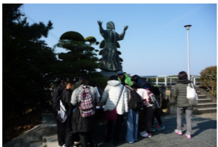
ポイントでクイズに挑戦