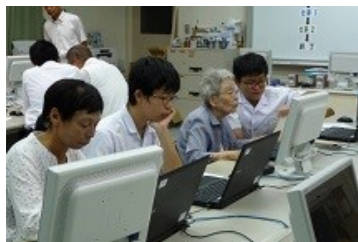
パソコン教室の様子

定員に3名程度の空きがございますので、第2回目以降の受講を希望される方につきましては、東部・南部公民館事務局（TEL25-0360）まで、お問合せください。