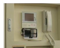
緊急地震速報発報端末機

これまで何度も訓練を重ねてきているだけあって、どの学年も素早く整然と行動できましたが、正門前を横断するときの混雑や、(訓練当日の体調不良のため)屋上に避難する児童の移動の仕方などの課題も挙げられます。今後の指導に生かしていきたいと思います。今回の訓練も、大勢の皆様のご協力を得てスムーズに進めることができました。ご協力ありがとうございました。