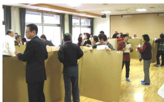
←ダンボールを使ったパーティション(間仕切り)づくり