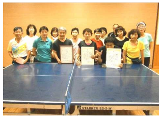
卓球サークルの皆さん

総勢237名の方が参加され、公民館卓球サークルからは、ママさんベテランの部に2名、初心者部に7名出場しました。