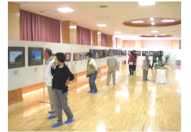
昨年度、写真展の様子

会場：東陽中学校2階多目的ホール(写真展) 東部公民館 大集会室・和室(文化展) ※両展示会とも、公民館玄関からご入場ください。